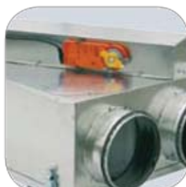
Τύπος με by pass

Ο τύπος BP διαθέτει αναστρέψιμο σύστημα by pass με ηλεκτροκίνητο damper